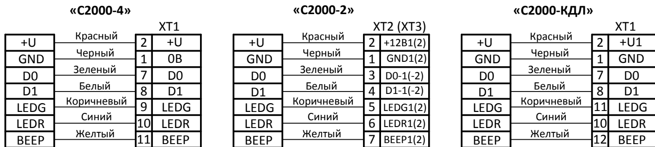
Рисунок 2. Схемы подключения к ПКП и контролерам СКД (контроллер всегда слева)

Назначение и цвета проводов для подключения считывателя приведены в таблице 2.2.4.1.