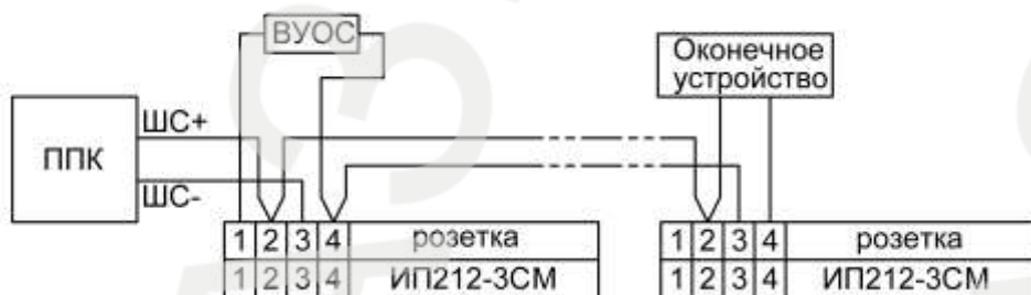
Рисунок 1 – Схема включения

На рис.1 показана типовая схема включения в двухпроводный шлейф пожарной сигнализации при фиксации сигнала «ПОЖАР» по одному извещателю. Схема и номиналы оконечного устройства, определяют производители ППК. Схема включения с фиксацией сигнала «ПОЖАР» по двум извещателям, а также расчет сопротивлений приведены на сайте компании–разработчика.